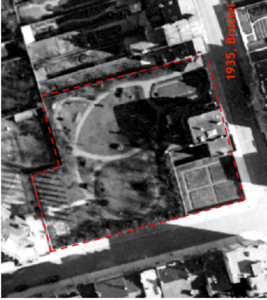
Propriété Danckaert en 1935