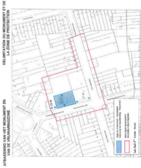
Schéma du périmètre de classement et de la zone de protection, proposé en 2022 et acté en 2024