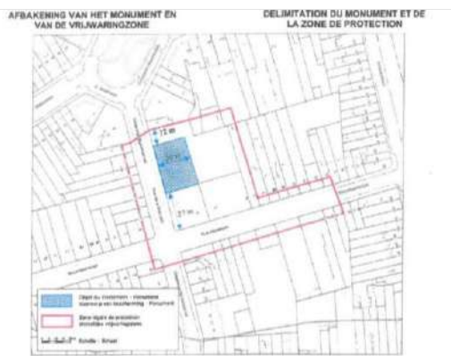
Gezien om te worden gevoegd bij het besluit van 20 juni 2022 Vu pour être annexé à l'arrêté du 20 juillet 2022