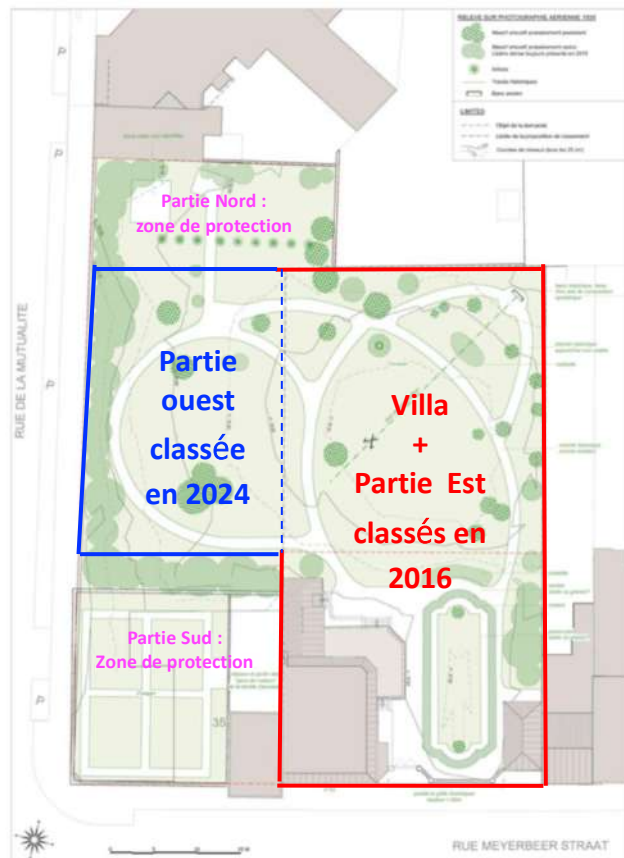
Le chemin de promenade retrouve sa cohérence originale.